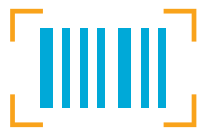
codici a barre